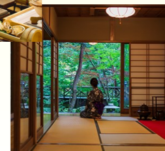
茶室清流庵で一服のおもてなし