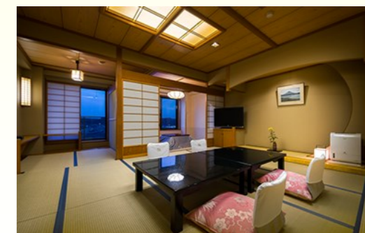
ちょっと広めのゆったり客室