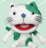
ポラ猫ぬいぐるみ